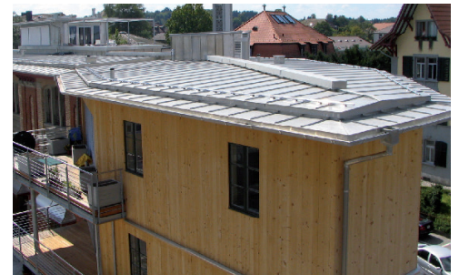
Alte Kohlenhandlung, Langenthal - Schweiz Architekten: Blum & Rossenbacher Ausgeführt mit dem Werkstoff K41, Oberfläche UGINOX Patina.